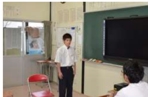
(面接セミナーより)